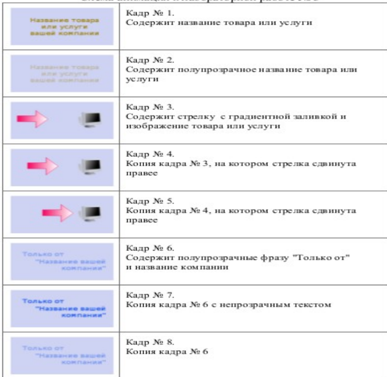
Схема анимации к лабораторной работе № 3